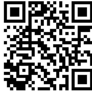
QR koodi https://engs.fi/new-school/

Lukemalla oheisen QR-koodin puhelimesi pääset seuraamaan koulun rakentamista Englantilaisen koulun nettisivuilta.