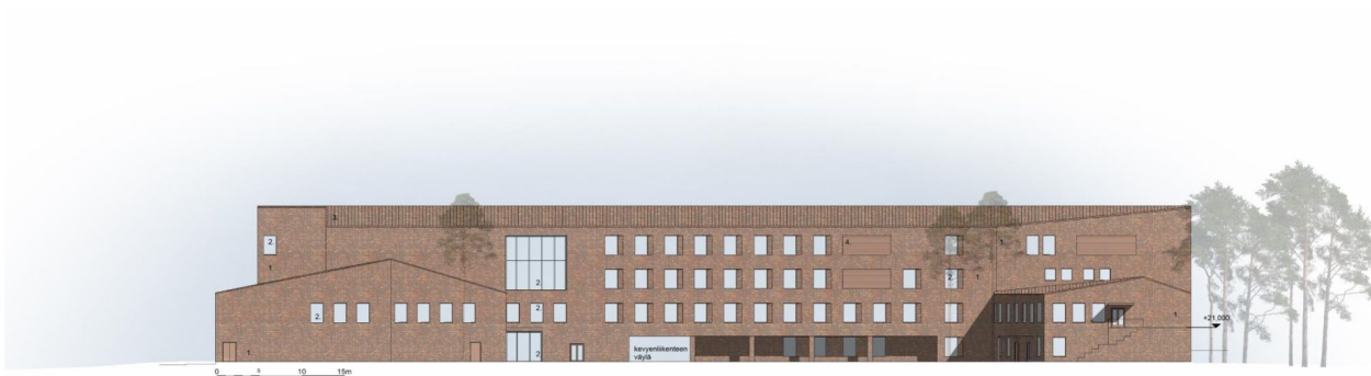
Pohjoisjulkisivu 1 : 400